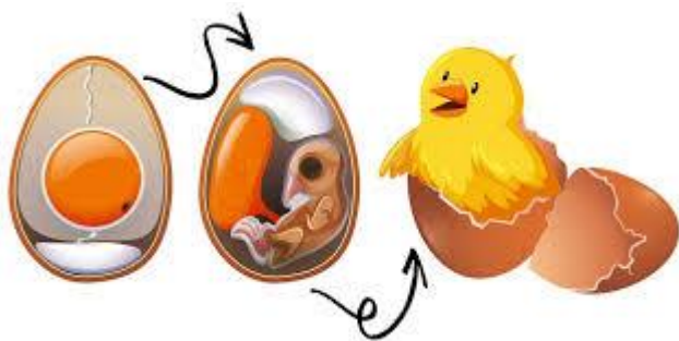
FIG.1- SVILUPPO DEL PULCINO NELL'UOVO

https://youtu.be/zq2nCER5hp0 NASCITA DEI PULCINI