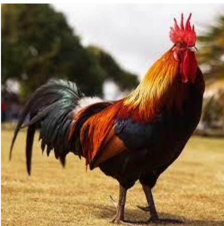
FIG.5 – GALLO

https://youtu.be/K3CenN7d30Y CANTI DEL GALLO