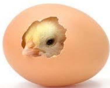
FIG. 2- NASCITA DEL PULCINO

https://1drv.ms/u/s!AvwfpAmAX-w-hGZQ0CDauipv0rUT AUDIO MAESTRA- PULCINI,POLLI,GALLINE, GALLI